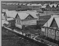
Центральная усадьба ОАО АП «Россия» - в Юдино.