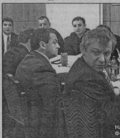
На заседании городского Совета.

На очередном заседании городского Совета народных депутатов был рассмотрен ряд важных вопросов. Первым на повестке дня был вопрос о контрольных органах городского Совета народных депутатов. С предложением о вынесении аудита на муниципальном уровне выступил председатель Владимирской контрольно-счетной палаты В.Д.Четчин. Это независимая самостоятельная организация, подотчетная лишь Законодательному Собранию. Помощь высококвалифицированной контрольно-счетной палаты будет весьма эффективной и практически безвозмездной, поэтому депутаты дали добро.