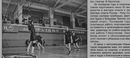
В с/к им. Паушина