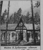
здание визит-центра НП «Мешиера».

«Русские обряды, традиции, обычаи» так называлась тема конкурса, который имеет общее название «Что мы знаем о старине и русских бытах». Он проводится уже второй год, т.е. становится традиционным. Местом проведения конкурса является величественный архитектурный ансамбль уютном основном лесу на турбазе «Хрустальный». 15 декабря визит-центр радушно принимал гостей нашего конкурса, которые при-