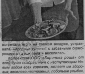
встретили его на свежем воздухе, устраивая народные гуляния, с забавными символами от души гелла и веселились. Коллеги ООО «Барнинова рош» от себя были благодарны с наступающим Новым годом всех горожан, желаем им здоровья и всевозможных успехов, любви, улыбок и почаще заглядывать к нам. В.ИВАНОВА. На снимках: в банкетном зале; угощение гостей; бар; вечерние свечки; вкусные пирожки; стеловые обрядники. Ольга Свиринова

Сейчас у нас проходит предновогодний праздник, старались сделать их необычными, по-настоящему волшебными. А оформить залы и банкетам помогали Владимирские профессиональные артисты Владимирского ансамбля «Визаж», хореографического центра «Хрустальный районо». Многие горожане из всей страны посетили в гостинице, есть слухи: «К нам даже москвичи приезжали на отдых. Но по ряду разных оснований, обязательно вновь вернутся. Каждый новогодний праздник наш регион. Публика всеого