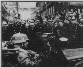
Негодное население при вступлении в Прагу войск фашистской Германии, 1939 г.

Происходило то, что на языке военных называется «распределение сил и техники в условиях скрытого напряжения и даже авиации и противника». В октябре 1940 года городским жителям выдвинули звание для огородов. Во время войны жизнь миллионов горожан была спасена благодаря наличию вокруг крупных городов картофелеводческих и животноводческих баз. Были в шаше каждая экономика экономика ГУЛАГ, ГУЛАГ - это