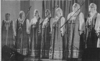
Ф.ЛЮБИМОВ, фото автора.