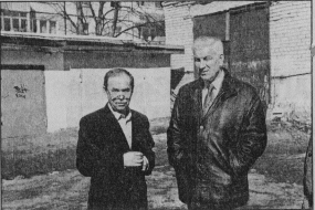
обустройство футбольного поля в городе.

Состояла проблема управление по социальным вопросам - нововведение выделенных финансовых средств. Выделенные административные деньги освоены только на 17%! На 2010 г. запланировано выделить более 729 тысяч рублей на