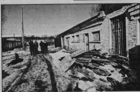
в этом здании в Гусь-Хрустальном будет пункт передержки беспризорных животных.