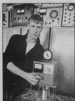
Студенческий проект «А. Т. 1 Мульти...»

Органично, красиво и даже профессионально смотрятся учебные стемы организации рабочих мест по монтажу трубок электротехнических проводов, оснащенные не только соответствующим инструментом по монтажу и наладке, но и оригинальным встроенным оборудованием по оснащению, включая рабочее место, полные набор