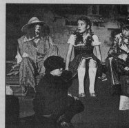
«Лепле», «Мама», «От сказки к сказке», «Буратино», «Шарена-лагуша», «Волшебник Андриус с нами».