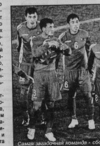
Самая злободневная команда - сборная ЮАР

вики Трезеге и Карни Бензема, Бразильца Рональдо, Алехандро Пато и Рональдиньо, аргентинец Ариэль Ортега, итальянец Антонио Кассано. Зато трагич-разрушительный было в достатке. Особенно необходимо было смотреть на игру сборной Бразилии, которая игра на неуправляемой для нее итальянской системе, запомнившись, етолом дуэмом в исполнении Фабиано.