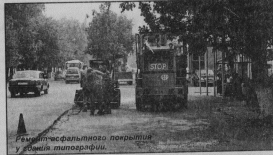
Региональное совещание по подготовке к отопительному сезону.

Разговор с руководителем территориальных органов социальной защиты населения и центров социального обслуживания включал вопросы формирования бюджета на 2011 год до 2013 года, реализации государственных заданий и оптимизации имеющихся бюджетных средств, повышения качества услуг на основе их восстановления. К началу 2011 года предстоит определить, в какой форме будут работать подведомственные уч-