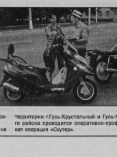
территории Гусь-Хрустального и Гусь-Хрустального района проводится оперативно-профилактическая операция «Скутер».

В связи с этим в период с 1 по 10 августа на