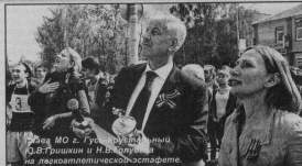
Внеурочная физкультурная деятельность учащихся МО с. Гусь-Хрустальный на Лыкопильнической эстафете.

где уже есть определённые результаты. К сожалению, новых видов спорта не так много, но если мы будем развивать уже традиционные для нашего города, укреплить материальную базу, то, надеюсь, поднимем гусевский спорт на тот уровень, который позволял бы нашим атлетам 20 лет назва. Предпочтислы есть, хотя есть и трудности.