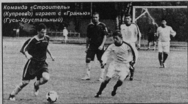
Команда «Строитель» (Муниципальное образование «Грань» (Гусь-Хрустальный район))

На хорошем уровне проводится работа коллективов физкультуры Формы «Символ», ООО «РЭСКО», муниципальных образований в Уршельском, в Золотово, Курьевское, Григорьевское и Демидовское. На достойном уровне коллективы физкультуры в Краевое ЗО, п. Иванчик. В этом немалая заслуга руководителей