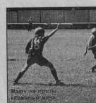
Мальки на призы «Кожаный мяч».

Очень ждем ввода в эксплуатацию физкультурно-оздоровительного комплекса с ледовым катком.