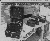
Экспозиция музейной комиссии