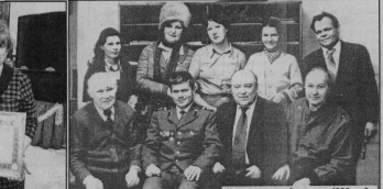
Коллектив редакции в 1986 году.