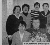
Коллектив редакции в 2008 году.