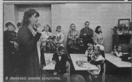
В детской школе искусств.