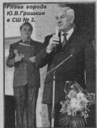
Глава города Ю.В. Гришкин в СШ № 2.