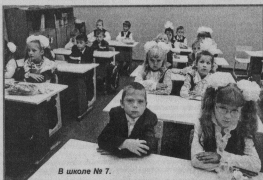
В школе № 7.