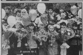
В школе № 2.