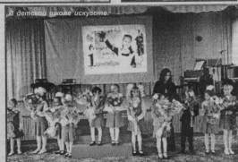
В детской школе искусств.