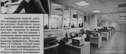
В операционном зале