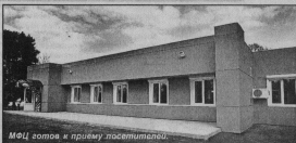
МОЦ готов к приему посетителей

7 сентября стал знаменательным днем для жителей Гусь-Хрустального города и района - состоялось торжественное открытие монофункционального центра предоставления государственных и муниципальных услуг.