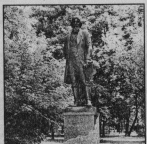
Памятник Малевичу в Музее Хрустальный фото А.Зубовова.

Какой особенно важен и радостно в Детской школе искусств 27 октября. И вовсе не потому, что суетились в коридорах детвора, примеряя яркие, зералятые танцевальные костюмы - ведь скоро золотой праздник для начинающих. И не по причине смелых репетиций к готовящемуся концерту. Праздн 27 октября произошло радостное событие: открылась выставка творческих работ новичков художественного отделения «Первые шаги». Ребята прозвонили в детской школе искусств дважды за месяц, а уже многому научились, благодаря работным