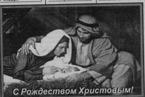
С Рождеством Христовым!

TV-1000-РОССИЯ 7.00 МЕГАПОЛИС 9.00 ВЕСНА НА ЗАРЕЧНОМ УЛИЧЕ 11.00 ПРЕДУПРЕЖДЕНИЕ ПРОГНОЗА 13.00 ОТКРОИТЕ, СЛЕД БЕЗ ПРАВИЛ 17.00 СЕЗОН ТУМАНОВ 19.00 КАК ПОМАТЬ МАГАЗИНОМ ВОРА 21.00 ХОЛОДНОЕ СОЛНЦЕ 23.00 ОЧКА 1.00 ЭКВАТОР 3.00 ЖИВОПИСНАЯ АВАНТУРА 5.00 ЧЕТЫРЕ ВОЗРАСТА ЛЮБИ