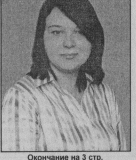
Описание на 3 стр.