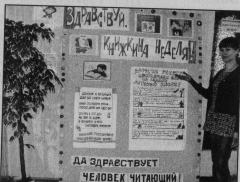
«ДА ЗДРАВСТВУЕТ ЧЕЛОВЕК ЧИТАЮЩИЙ»

Изображения в зале школьного музея проведены три трюки участника игры. Ребята предостерегли ответы на вопросы ведущего, определив названия и авторов книг. Это очень знаменитые и любимые читателями разных поколений художественные произведения: «Золотой ключик, или Приключения Буратино» А. Толстого, «Дядя Степа С. Михалкова, «При-