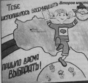
С.ФРОКИН. Фото автора