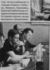
Журналисты за работой.

Статье компании сегодня - это стремление к высокому качеству предоставляемых услуг, социальная ответственность за результаты своей работы перед населением области. А.С. Филиппов отметил, что «Владимиртеллогаз» в настоящее время занимает ведущие позиции среди крупных налогоплательщиков в экономике области. Модернизировано большое количество материально-утиляционных компаний в области. Построено немало современных объектов. Находясь в центральной теллоснабжающей и управляющей организации и предпринимательской. Связи общества «Владимиртеллогаз» (объединяет 66 компаний, 50 филиалов и 7 городов). В число абонентов ООО «Владимиртеллогаз» входят