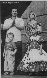
Победители и лауреаты конкурса.

Обе Викторины Балашов стал победителем в номи-