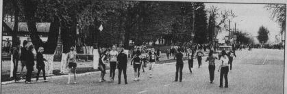
На легкоатлетической эстафете.

Желаем крепкого здоровья, благополучия в семье и долгие лет существования среди ветеранов по футболу и хоккею.