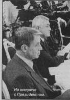
На встрече с Президентом