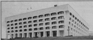
фа общей площадью 110,2 тыс. га. Балансовые запасы торфа по ним составляют более 130,5 млн тонн.

В настоящее время во Владимирской области насчитывается 723 месторождения тор-