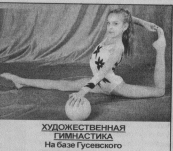
ХУДОЖЕСТВЕННАЯ ГИМНАСТИКА На базе Гусевского спецального колледжа Девочки 4-5 лет. Понедельник, среда, пятница с 18.00, суббота с 10.00

МЫ ЖДЁМ ВАС ПО АДРЕСУ: ул. КРАВЧИНСКОГО, 4а Справки по тел. 2-36-62, а также всю интересующую информацию вы можете посмотреть на нашем сайте: www.sport.gus-info.ru