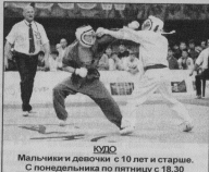
ДЖУДО Мальчики и девочки с 10 лет и старше. С понедельника по пятницу с 18.30