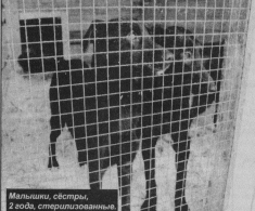
Малышка, 6 месяцев, вестр, 2 года, стерилизованная.