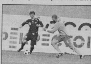
ФУТБОЛ Мальчики с 2003 года и старше С понедельника по пятницу с 14.00 Стадион «Труд»