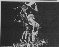
БАСКЕТБОЛ Мальчики с 9 лет и старше. Обращаться по телефону: 8-910-180-68-70