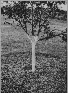
Побеги укрывают на 13, корневая шейка расположена на уровне почвы, высаженные растения обильно поливают, почва замульчирована.

Уход за плодами предполагает их подготовку к зиме. Для этого, если об этом не позаботились природа, обильно поливая растения, внести фосфорные и калийные удобрения, прищипнуть зеленые побеги на деревьях и кустарниках.