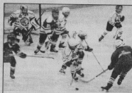
ХОККЕЙ С ШАЙБОЙ Мальчики с 9 лет и старше Вторник, четверг, суббота с 9.00 и с 15.00