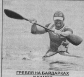
ГРЕБЛЯ НА БАЙДАРКАХ И КАНУ Мальчики и девочки с 10 лет и старше Понедельник, среда, пятница с 9.00 и с 15.00