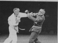
РУКОПАЩНЫЙ БОЙ Мальчики и девочки с 10 лет и старше. С понедельника по пятницу с 18.00