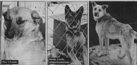
Рин, 1,5 года.

РЕКЛАМА ГАЗ-66, бортового, кузов от ГАЗ-53, в хор. сост. Тел. 8-920-925-83-90. Ремонт компьютеров, ноутбуков, помощь в покупке. Тел. 8-904-599-53-86. Колодцы, канализация, копка, от 2 тыс. рублей - копылко. Т. 8-904-599-53-86.