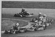
КАРТИНГ Район школы №1 СТК «Кварц» Мальчики с 8 лет и старше вторник, четверг, 17.00-19.00 суббота 13.00-15.00

Спортсмены неоднократно становились победителями и призерами престижных соревнований.