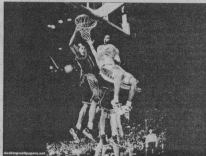
БАСКЕТБОЛ Мальчики с 9 лет и старше. Обращаться по телефону: 8-910-190-68-70