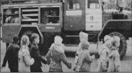
Гусь-Хрустальский район, Гусь-Хрустальский район.

В первой декаде сентября прошли тренировочные эвакуации на случай возникновения пожара в городских школах, учебных заведениях дополнительного образования детей. В очередной раз дети вспоминали эти правила поведения при пожаре, правила выхода из здания школы и убрали в специально отведенном месте - на пришкольном участке. В профилактической работе с учащимися дополнительного образования детей, в организации раздаточных материалов, показ поделок техники и просмотр учащимися видеороликов по соответствующей тематике.