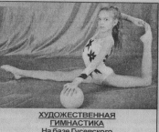
ХУДОЖЕСТВЕННАЯ ГИМНАСТИКА На базе Гусевского спецшкола колледжа Девочки 4 - 5 лет. Понедельник, среда, пятница с 18.00, суббота с 10.00

МЫ ЖДЁМ ВАС ПО АДРЕСУ: УЛ. КРАВЧИНСКОГО, 4а Справки по тел. 2-36-62, а также всю интересующую информацию вы можете посмотреть на нашем сайте: www.sport.gus-info.ru