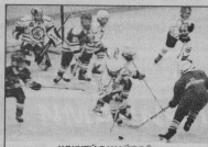
ХОККЕЙ С ШАЙБОЙ Мальчики с 9 лет и старше Вторник, четверг, суббота с 9.00 и с 15.00