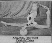
ХУДОЖЕСТВЕННАЯ ГИМНАСТИКА На базе Гусевского спецшкола колледжа Девочки 4 - 5 лет. Понедельник, среда, пятница с 18.00, суббота с 10.00

МЫ ЖДЁМ ВАС ПО АДРЕСУ: УЛ. КРАВЧИНСКОГО, 4а Справки по тел. 2-36-62, а также всю интересующую информацию вы можете посмотреть на нашем сайте: www.sport.gus-info.ru