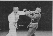
РУКОПАШНЫЙ БОЙ Мальчики и девочки с 10 лет и старше. С понедельника по пятницу с 18.00