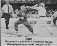
ДЖУДО Мальчики и девочки с 10 лет и старше. С понедельника по пятницу с 18.30