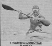
ГРЕБЛЯ НА БАЙДАРКАХ И КАНОЭ Мальчики и девочки с 10 лет и старше Понедельник, среда, пятница с 9.00 и с 15.00