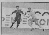
ФУТБОЛ Мальчики с 2003 года и старше С понедельника по пятницу с 14.00 Стадион «Труда»