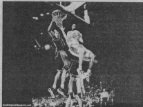
БАСКЕТБОЛ Мальчики с 9 лет и старше. Обращаться по телефону: 8-910-190-68-70