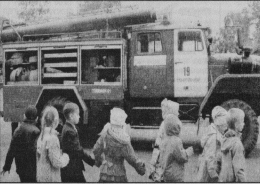
ГЧ «ОАПС» по Владимирской области.

В первой декаде сентября прошли тренировочные эвакуации на случай возникновения пожара в городских школах, учебных заведениях дополнительного образования детей. В очередной раз дети вспоминали эти правила поведения при пожаре, правила выхода из здания школы и убрали в специально отведенном месте — на пришкольном участке. В профилактическую работу с учащимися дополнительного образования детей, в очередной раз дети вспоминали эти правила поведения при пожаре, правила выхода из здания школы и убрали в специально отведенном месте — на пришкольном участке. В профилактическую работу с учащимися дополнительного образования детей, в очередной раз дети вспоминали эти правила поведения при пожаре, правила выхода из здания школы и убрали в специально отведенном месте — на пришкольном участке.