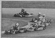
КАРТИНГ Район школы № 1 СТК «Кварц» Мальчики с 8 лет и старше вторник, четверг, 17.00-19.00 суббота 13.00-15.00

Спортсмены неоднократно становились победителями и призерами престижных соревнований.