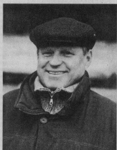
планируем специально для него построить хранилище.

— От советских времен у нас ничего не осталось. Для возделывания чипсовый сорт картофеля используем современную импортную технику. Она не травмирует клубни, полностью обрезаем, ручного труда у нас практически нет. Лишь на сортировке картофеля у импортных троллей есть небольшая работа и отбор поврежденных клубней, зеленый и негодный картофель. Мелкий сразу же отделяем.