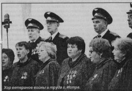
Хор ветеранов войны и труда в. Истры.