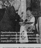
Профессор и артист хора имени С.М. Прокофьева