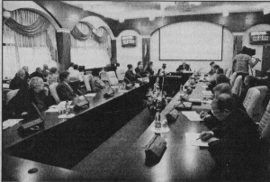
Губернатор Н.Виноградов: «Нужно резко активизировать усилия по учету и использованию земельных ресурсов».

ресурс, ценность которого усиливается еще и тем, что в нашем регионе нет серьезных месторождений полезных ископаемых. Но в силу разных причин это наш уникальный земельный ресурс недостаточно используется в регионе, - отметила Жанна Николаевна. - В частности, около 20 процентов всех земель сельскохозяйственного назначения сегодня не используются в хозяйственной деятельности.