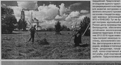
Подготовлено пресс-службой администрации Владимирской области.