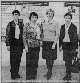
В рамках мероприятия прошли «круглые столы» по темам: «Общественная безопасность семьи, детства и молодежи».