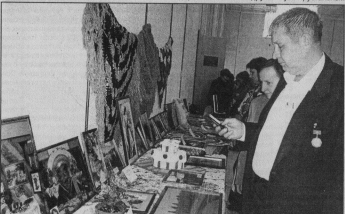
У выставочной экспозиции народных умельцев Гусь-Хрустального района.