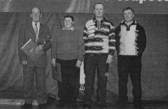
Неравнодушные старосты Гусь-Хрустального района.

район удостоился похвалы Губернатора за успешное проведение районных Дней сельского старосты, а также за строительство новых колодезь и поддержание в нужной кондиции действующих. Из 206 предложенных старост, большая часть приходится на Гусь-Хрустальный и Судогодский районы. В текущем году реализовано более половины мероприятий.