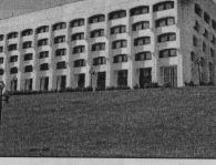
1945 годов» за счет средств федерального бюджета 35 ветеранов приобрели жилье, 126 - получили единовременную денежную выплату на строительство и приобретение жилья.

С 1 января 2012 года размеры пособий, компенсаций и денежных выплат ветеранам труда, труженникам тыла, семьям с детьми и другим региональным категориям льготников увеличены на 6,5%. Государственные пособия, предусмотренные на федеральном уровне, проиндексированы на 6%.