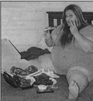
Человек прибавляет 30-50% от потерянной массы. Ну и «сидеть» на такой диете долго - значит подвергать свое здоровье большой опасности. Нередко наблюдается полный голод, слабость кожи, выпадение волос, а в 25% случаев развивается молочнокислая бактерия.

Несмотря на то, что диет много огромное количество, все их можно разделить на несколько типов по приблизительной или ограниченной в них или в них компонентов пищи, диет с умеренным понижением энергетической ценности, диеты с ограничением жиров, диеты, в которых рекомендуются на оборот увеличивать содержание жиров в ра-