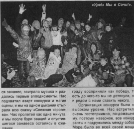
«Ура! Мы в Соул!»

Но все волнения и сомнения ушли на задний план, когда откры-