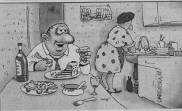
«Хороший праздник - 8 марта», Жаль, кончается быстро...