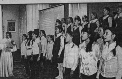
Приезд французской певицы Жан Целлерони в Гусь-Хустьинский ДШИ.