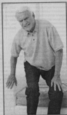
роз, остеохондроз, бурсит. Его часто применяют и в борьбе с другими недугами. Полный перечень показаний (более 60) приведен в паспорте изделия.

• Аппарат предназначен для лечения заболеваний опорно-двигательного аппарата, таких как артрит, артроз, остеохондроз, бурсит. Его часто применяют и в борьбе с другими недугами. Полный перечень показаний (более 60) приведен в паспорте изделия.