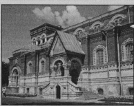
Музей Хрустала им. Мальцовых будет работать до позднего вечера