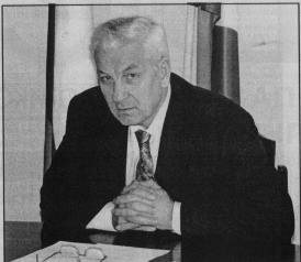
соба управления домом в дальнем.

Обращу ваше внимание на высокие затраты по управлению домом. В 2010 году они составили 42,5% от общих расходов; в 2011 году - 53%. — Все эти данные свидетельствуют о том, что вам надо серьезно подумать над выбором спо-