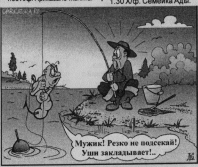
Музыка! Редко но повсюду! Узнай заключившего!

7.00 Х/ф. Кто ищет в последний вагон?!. 9.00 Х/ф. Будем на твоем. 11.00 Х/ф. Дилей. 13.00 Х/ф. Подкованная змея. 15.00 Х/ф. Интеренные мужчины. 17.00 Х/ф. Долгая роз. 19.00 Х/ф. Приказано женить. 21.00 Х/ф. Долгая роз. 23.00 Х/ф. Семайка. 1.30 Х/ф. Семайка.