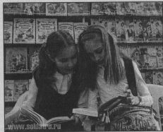
Творческих удач, благополучия и доброго здоровья!

Милые подмамы книжного моря, Феи, дарящие радость другим, труд ваш невидим порою, но упорен и, безусловно, необходим.