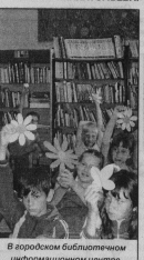
В городском библиотечном информационном центре