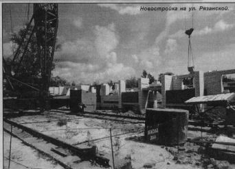
Новостройка на ул. Рязанской.