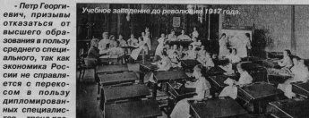
Учебное заведение до революции 1917 года.