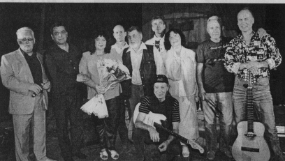
Фоторафия участника концерта на память.