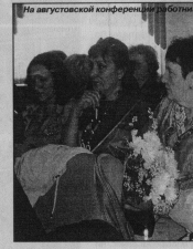
Обращение внимание не только на то, как учим, но и на создание материально-технической базы.

Из-за низкой зарплаты не хватает кадров. Из-за недостаточного финансирования вынужден с ликвидированными муниципальными детскими садами в ряде ДОУ: это тем более актуально, т.к. на сегодняшний день заблаговременно детей в отдельных детских садах, особенно расположенных в