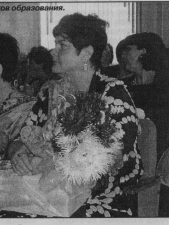
Обращение внимание не только на то, как учим, но и на создание материально-технической базы.

Формирование активных жизненных позиций учащихся дополнительного образования, отмечены дипломами департамента образования. На областном этапе Всероссийских олимпиад современных школьников «Президентские составы школьников» среди сельских команд-команды Урейской школы заняла 3-е место.