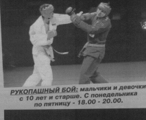
РУКОПАШНЫЙ БОЙ: мальчики и девочки с 10 лет и старше. С понедельника по пятницу - 18.00 - 20.00.