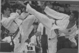
КАРАТЭ: мальчики и девочки с 10 лет и старше. С понедельника по пятницу - 18.30 - 20.00.