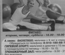
ФИТНЕС: вторник, четверг, суббота - 18.00 - 19.00

4 табло: БАСКЕТБОЛ: мальчики с 9 лет и старше. Обращаться по телефону: 8-910-180-68-70; ГИРОВОЙ СПОРТ: мальчики и девочки с 10 лет и старше, с понедельника по пятницу - 16.00 - 19.15; ТРЕНАЖЕРНЫЙ ЗАЛ: часы работы - 9.00 - 21.00, без выходных.