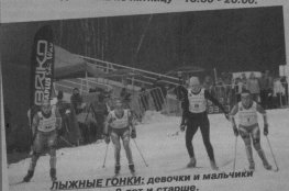
ЛЫЖНЫЕ ГОНКИ: девочки и мальчики с 8 лет и старше.