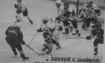
ХОККЕЙ С ШАЙБОЙ: мальчики с 9 лет и старше.