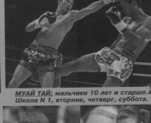
МУАЙ ТАЙ: мальчики 10 лет и старше. Школа N 1, вторник, четверг, суббота.