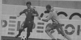
ФУТБОЛ: мальчики с 2006 года и старше. С понедельника по пятницу - 14.00. Стадион «Труд».

Приглашает детей и их родителей уделить внимание своему здоровью. Вас ждет интересная программа обучения в секциях, хорошая физическая подготовка. Основное направление деятельности - занятия с детьми и подростками, воспитание молодежи, пропаганда здорового образа жизни, участие в соревнованиях. Воспитанники спортшколы им. А.В. Паушкина принимают активное участие во всех крупных турнирах и чемпионатах России и за рубежом. Спортсмены неоднократно становились победителями и призерами престижных соревнований.