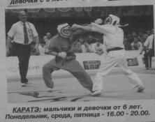
КАРАТЭ: мальчики и девочки от 6 лет. Понедельник, среда, пятница - 16.00 - 20.00.