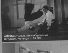
АЙКИДО: мальчики и девочки. Вторник, четверг - 19.30.