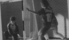
ФУТЗАЛ (МИНИ-ФУТБОЛ): девочки с 9 лет и старше.