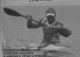
ГРЕБЛЯ НА БАМБУРКАХ И КАНОЭ: мальчики и девочки с 10 лет и старше.