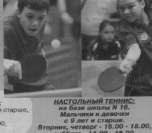
НАСТОЛЬНЫЙ ТЕННИС: на базе школы N 18. Мальчики и девочки с 9 лет и старше. Вторник, четверг - 16.00 - 18.00, суббота - 14.00 - 16.00.

4 табло: БАСКЕТБОЛ: мальчики с 9 лет и старше. Обращаться по телефону: 8-910-180-68-70; ГИРОВОЙ СПОРТ: мальчики и девочки с 10 лет и старше, с понедельника по пятницу - 16.00 - 19.15; ТРЕНАЖЕРНЫЙ ЗАЛ: часы работы - 9.00 - 21.00, без выходных.