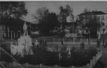
Площадь Свободы в 50-е годы XX века. Вид с торговых рядов.