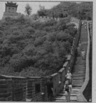
ки на одной площадке, почти в обнимку и никто не убирают. История, однако-с!

С удовлетворенным чувством покорителя стены спускались вниз, довольно пологийная на тех, у кого еще все внутри. Как выразился один мудрый человек: «Великие события как высокие горы, нужно отойти от них, чтобы оценить». Так и сейчас, спустя время, хочется мыслить о том, что для большей правдоподобности можно было бы небольшие участки, как кирпичики, оставить без реставрации. Эффект от посещения, наверное, был бы больше. Также невольно приходила мысль: а как обстоит дело у нас, в России? История должна быть назидательной. К примеру, уже давно в Лондоне Кромвель казнил короля, сын Карла выкалывал того из могилы и мужественно, прилично объявлял, мстя за своего папу, Карла предвудеятого. А теперь им троим стоят памятники