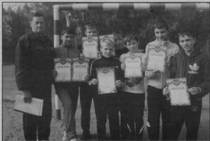
Команда-победительница © С. Волченковым.

С. ВОЛЧЕНКОВ, преподаватель физкультуры.