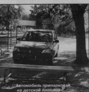
Автомобиль припаркован на sidewalk площадке.

Хочется напомнить индивидуальным предпринимателям, собственникам нежилых помещений, что они должны содержать в надлежащем порядке территорию, прилегающую к их объектам недвижимости в радиусе 5 метров, в частных домах - 3 метра по новым правилам благоустройства. Для фасадных частей собственных домов улицы с двухсторонней застройки определена территория до проезжей части дороги. Собственники нежилых помещений обязаны также содержать фасады в приличном состоянии, регулярно проводить их ремонт и покраску. К сожалению, бывает достаточно сложно установить владельца того или иного магазина.