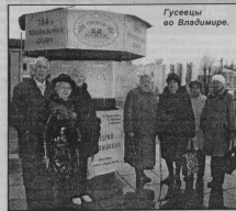
Гусевцы во Владимире.