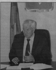
хозяйина: все-таки XXI век на дворе.

В нашем городе действует несколько рынков. Хотелось бы преобразовать в торговый центр, хрустальный - активно застраивается, даже «Поле чудес» начали строить (но не довели). Институтами Эко-Хотелось бы узнать, как обустроить или построить что-то современное вместо нашего эстакадного рынка-газона. Вроде у нас есть и рынок, но полная антисанитария и никакого сервиса. Появление на